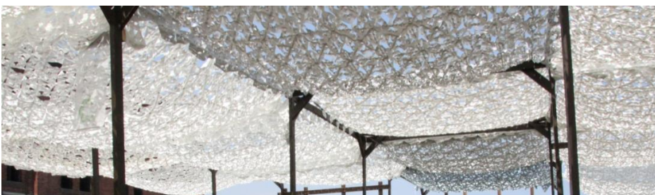
▲「フラクタルひよけ」設置例

「フラクタルひよけ」は、電気などのエネルギーを使用せず、設置するだけで優れた冷却効果を発揮する理想的な環境製品であり、その効果は公的機関や民間での実証実験によっても証明されています。