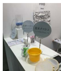
▲実験コーナー（イメージ）