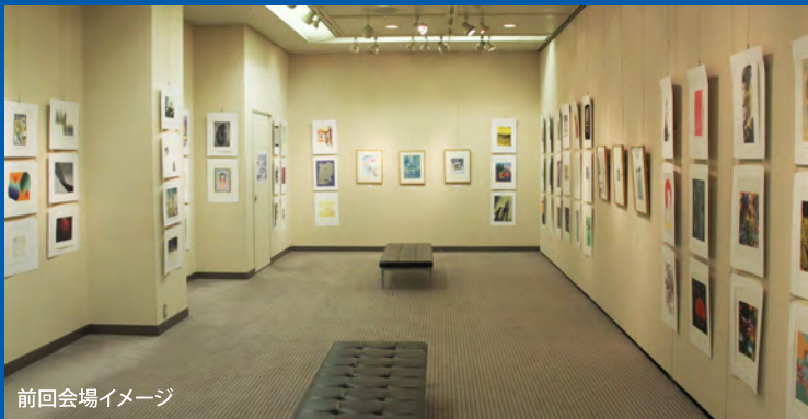
前回会場イメージ